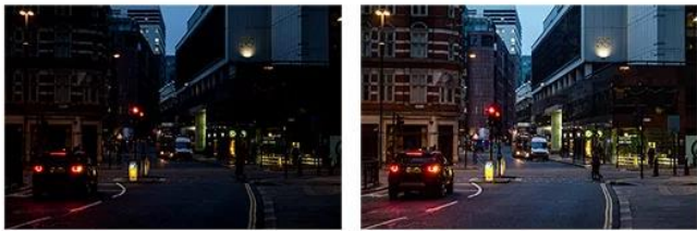
No CCTV Mode