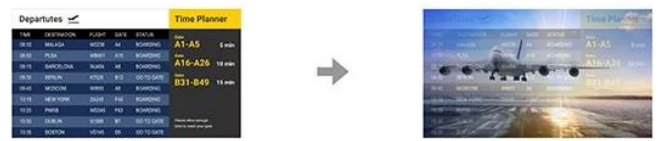
w/o Anti-Burn-in™ Technology