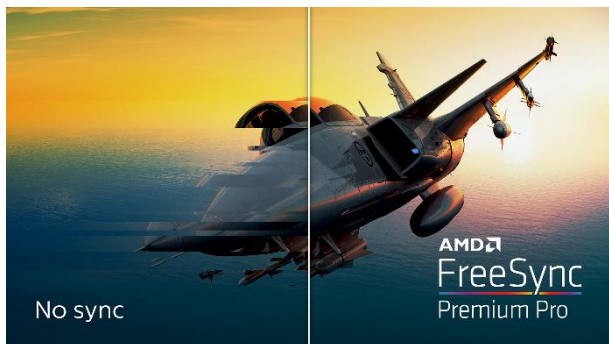
FreeSync Premium Pro технология