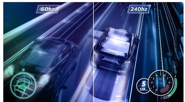
240Hz честота на опресняване

В допълнение към всички тези предимства, устройството предлага скорост и прецизност, каквито се изискват за игрите от последно поколение. С честота на опресняване от 240Hz , този дисплей визуализира до 4 пъти повече кадри в секунда в сравнение със стандартен такъв (60Hz). Това е от особена важност за игри с бързо действие и множество динамични сцени, като FPS и Racing, например. Времето за реакция на подсветката е 0.5ms MPRT , което на практика елиминира напълно замъгляването и размазването на движението. Снабден с технология AMD FreeSync Premium Pro , мониторът предоставя незабравимо изживяване при игра в HDR режим. Заедно с функцията за ниско закъснение на входящия сигнал ( Low Input Lag ), тя осигурява изключително плавен гейминг с максимална производителност и визуални ефекти с висок динамичен обхват. От друга страна, режимът SmartImage Game предлага бърз достъп до допълнителни прецизно настроени интерфейси за различните видове игри (FPS, Racing, RTS). Той включва и функцията SmartFrame , която позволява осветяване на конкретни зони, както и настройка на размер и картина.