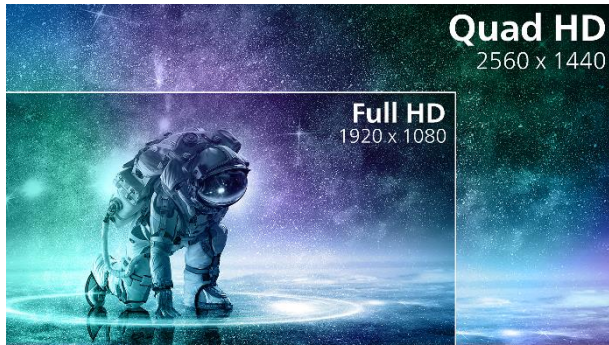
2K QHD резолюция

докато статичният контраст 4000:1 . Функцията DisplayHDR 400 , която е сертифицирана от VESA, предоставя динамични изображения с усъвършенствани цветни детайли, включващи по-дълбоки и наситено тъмни цветове. С помощта на локално затъмняване, тя визуализира богата палитра от нюанси за завладяващо сетивата изживяване. Мониторът покрива на 122% цветовото пространство на sRGB и на 92% това на DCI-P3 . Независимо от това, дали сте взискателен професионалист, работещ с CAD-CAM и 3D приложения, или пък финансов гений, ползващ огромни електронни таблици, Philips 32M2C5500W/00 ще ви осигури и в двата случая брилянтно ясни изображения.