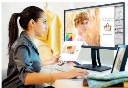
Дизайн и Печат