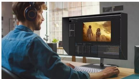
Професионална обработка на видеоклипове