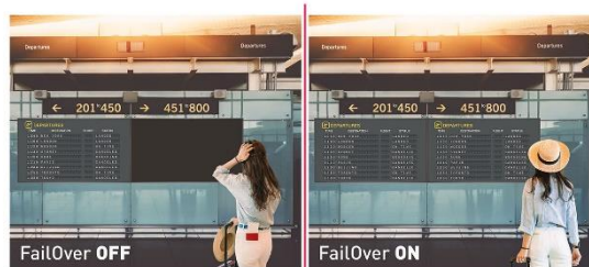
Signal FailOver функционалност

Всички устройства от новата LHxx60-та серия са създадени за интензивна 24/7 дейност и разполагат с вграден WiFi модул за безжична презентация. Благодарение на патентования от японската компания софтуер iiSignage² за показване и управление на дигитално съдържание, потребителят може лесно и сигурно да създава, редактира и контролира своите информационни съобщения и реклами, при това от разстояние. Функцията Signal FailOver автоматично открива алтернативен входящ източник на сигнал, в случай че няма такъв от входа по подразбиране и моментално превключва на него. Тя позволява допълнително приоритизиране на портовете (включително браузър, медия плейър и потребителски) и гарантира непрекъснатост на визуализираното съдържание. EShare е многофункционално приложение за безжична комуникация, предназначено за бизнеса и образованието. С него потребителят може безпроблемно и лесно да споделя екранно съдържание за по-голяма ефективност и ангажираност в работния процес. В окомплектовката на всеки един от моделите от LHxx60-та серия е включен и допълнителен набор от аксесоари за монтаж на стена. Тяхната гъвкава ориентация (пейзажна и портретна), елегантно-тънък дизайн и висока 24/7 надеждност осигуряват лесно и удобно интегриране във всяка бизнес среда. Тези професионални IYAMA дисплеи предоставят първокласна картина и са идеалното бюджетно решение за визуализиране на дигитална реклама в търговски обекти, хотелски комплекси, изложбени зали и корпоративни пространства.