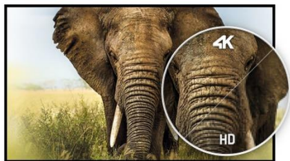
4K UHD резолюция

и възможност за работа в портретен режим гарантират безпроблемното им интегриране във всяка търговска или корпоративна среда.