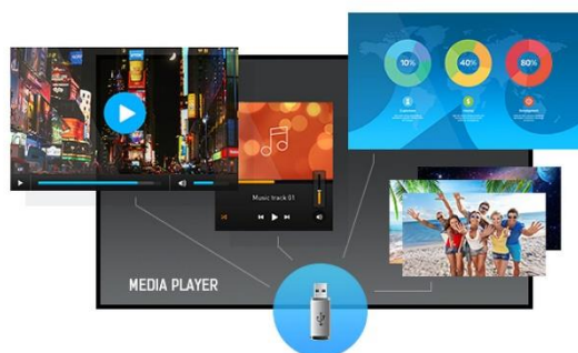
Интегриран Media Player